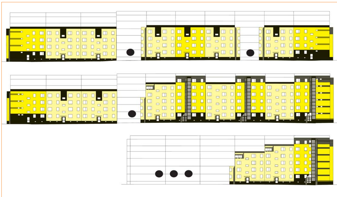
Die Grafik zeigt die geplante Umgestaltung des Quartiers Rudelsburgstraße 7–60.

Damit das Wohnen in Bieblach-Ost noch mehr an Attraktivität gewinnt, gibt es zwischen der GWB „Elstertal“ und WBG „Aufbau“ Gera eG ein beachtliches gemeinsames Projekt in der Rudelsburgstraße. Die beiden Wohnungsunternehmen werden in ihren Quartieren mit Teilrückbau, Grundrissänderungen und Modernisierung dem nahe dem Roschützer Sportplatz gelegenen Wohnkomplex zu Leibe rücken. Die GWB „Elstertal“ wird in die Umbaumaßnahme 5,7 Millionen Euro und die WBG „Aufbau“ 4,3 Millionen Euro investieren. Das Vorhaben umfasst in der Rudelsburgstraße die „Aufbau“-Häuser 22 bis 40 und die „GWB“-Häuser 10 bis 20 und 42 bis 60. In die bauliche Umgestaltung des Quartiers werden 348 Wohneinheiten