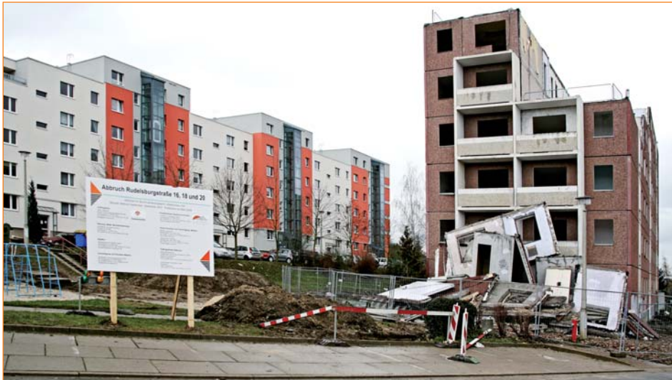
Dem Teilabriss in der Rudelsburgstraße folgen umfangreiche Sanierungs- und Modernisierungsmaßnahmen.