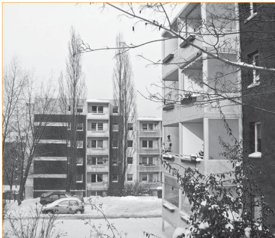
Die Architektur der terrassenförmig gestalteten Häuser setzt neue Akzente der Wohnqualität in Bieblach-Ost.

GWB „Elstertal“* und WBG „Aufbau“ Gera e.G. schlossen gemeinsames Sanierungsprojekt im Quartier Rudelsburgstraße ab