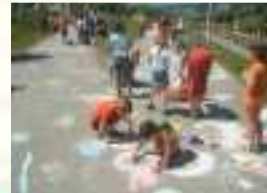
Kindermalaktion auf dem Fuß- und Radweg

Dazu wurde ein Kurs für Internet- Einsteiger, Grundlagen des Internet-Marketings, der Webseitenerstellung sowie digitaler Fotografie und Bildbearbeitung vorbereitet und durchgeführt.